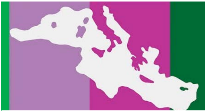
Michelangelo Pistoletto, Love Difference , 2002

The Love Difference Pastry Shop rediscovers and shares spaces where art and creativity contribute to developing society in a responsible fashion. In these spaces the taste of difference can be tested in the Love Difference desserts that stimulate and promote dialogue and exchanges between cultures.